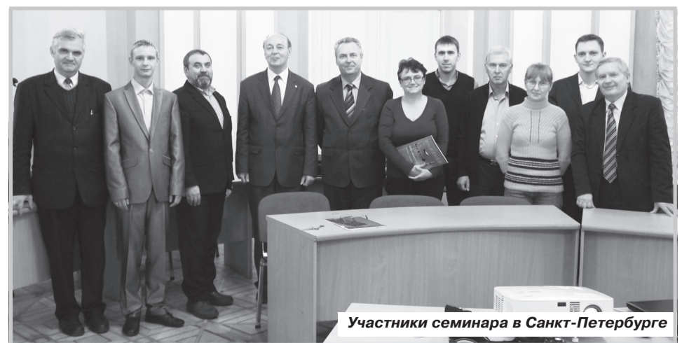
Участники семинара в Санкт-Петербурге

В Ереване обсуждались текущие результаты реализации проекта каждым университетом, были намечены планы на период до февраля 2014 г. Представители нашего вуза отметили прекрасную организацию встречи и гостеприимство армянских коллег.