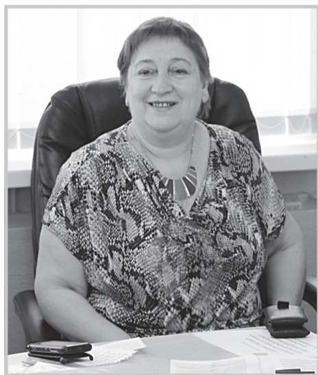
Профессор Г.П. Гагаринская

Сегодня число людей старше 60 лет ежегодно увеличивается в Европе на 2 миллиона, что в два раза больше по сравнению с 2007 годом. По некоторым прогнозам, через 5 лет число пожилых людей на Земле достигнет 1 миллиарда. Большинство демографов убеждены в необратимости данного процесса и заявляют, что мы вступили в «век пожилых людей». В европейских странах при небольшой численности трудоспособного населения велика доля людей пенсионного возраста, что создает сложности в системе социального обеспечения.